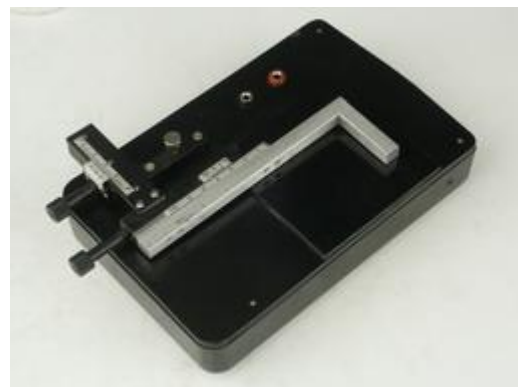
Kundenspezifische Spule (zusätzliche Bestellung)